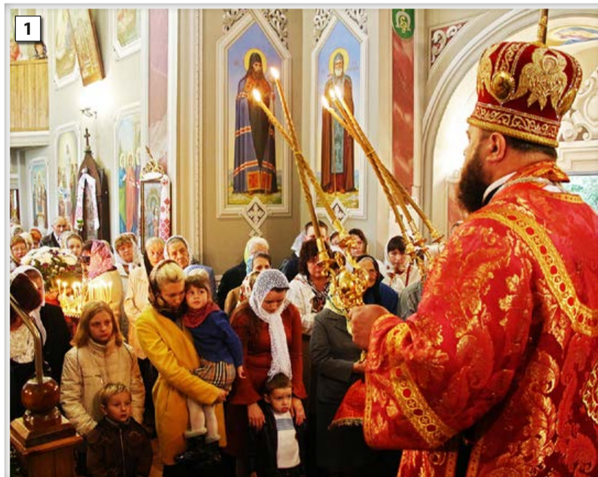
Лариса КУЛІШ Світлина 3, 5 з архівів священника Матвія Олійника та єпископа Матфея

Свято-Пантелеймонівська громада в Люблинці утворилась у 2005 році. Перші служіння проходили в каплиці – кімнаті місцевої амбулаторії. Потому перейшли у вагончик, який стояв просто в полі. На початку 2009-го завдяки старанням церковного старости за короткий час змурували й освятили каплицю. Одночасно було звершено чин заснування нового храму і поставлення хреста.