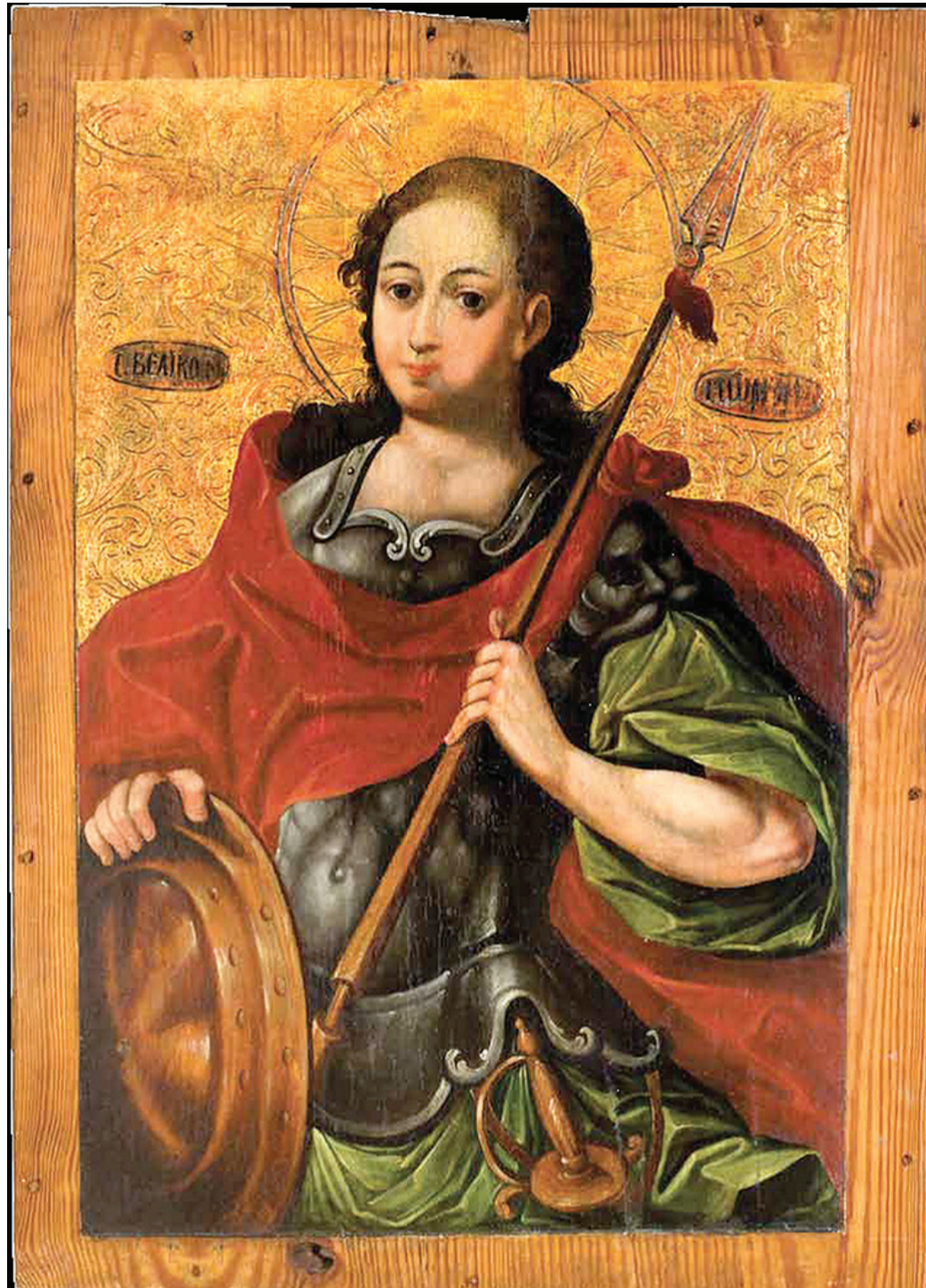
Святий Георгій Переможець. Середина XVIII ст. Походить із церкви Св. Георгія с. Кутрів Горохівського деканату. Матеріали і техніка: дерево, левкас, темпера, олія. Зберігається у Музеї волинської ікони.

Одним з найбільш відомих святих у християнському світі, а в деяких країнах і найбільш шанованим, був великомученик Георгій – як звивається у духовній брані названий Переможець.