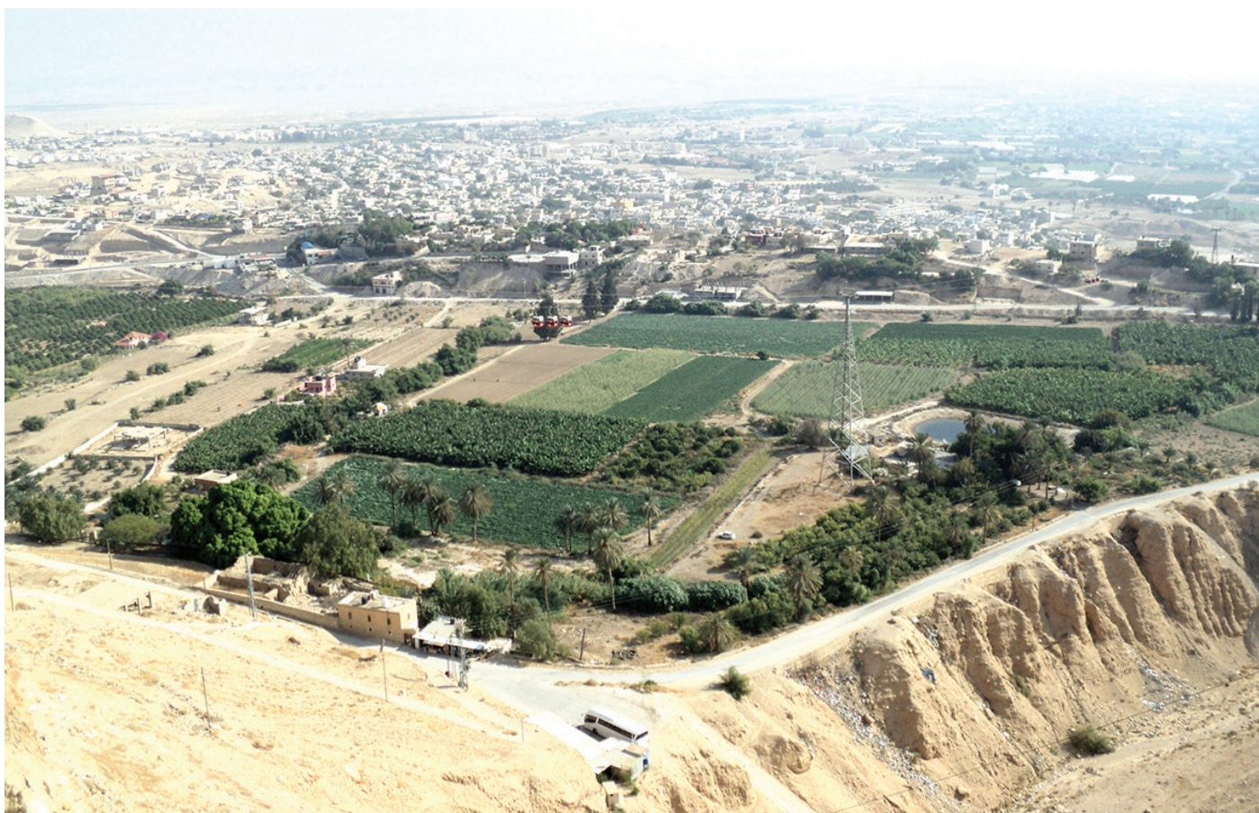
Долина міста Ерихон: штучне зрошення дає добрі плоди