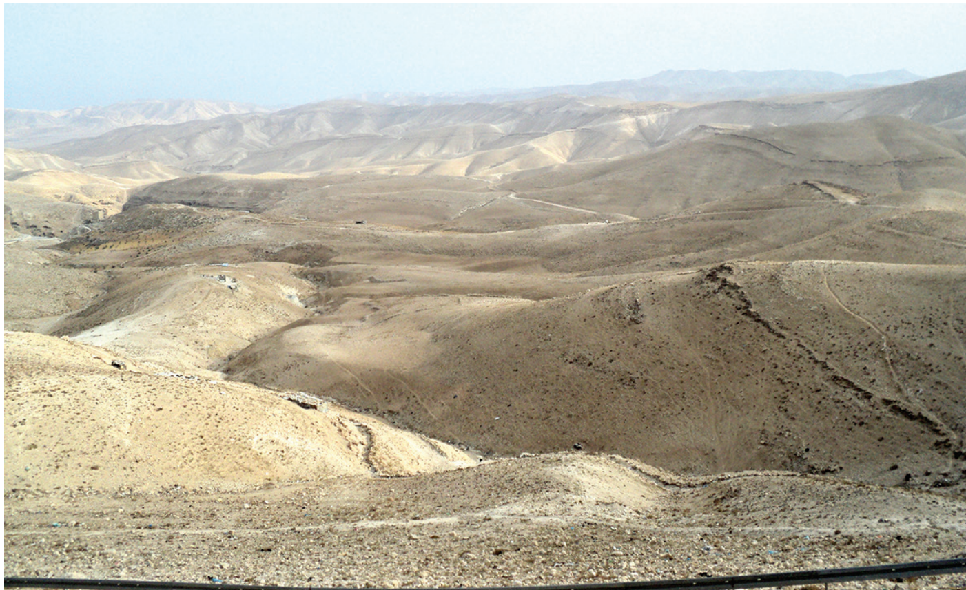
На цих ґрунтах Ізраїля не проросте навіть потужна насіння

Під впливом ідеї про те, що земля зрештою буде знищена, дехто почав спустошувати її цінні ресурси. Ще інші втратили будь-яку надію на майбутнє і живуть одним днем. Через це життя може втратити зміст. Якщо ж ми віримо, що зможемо