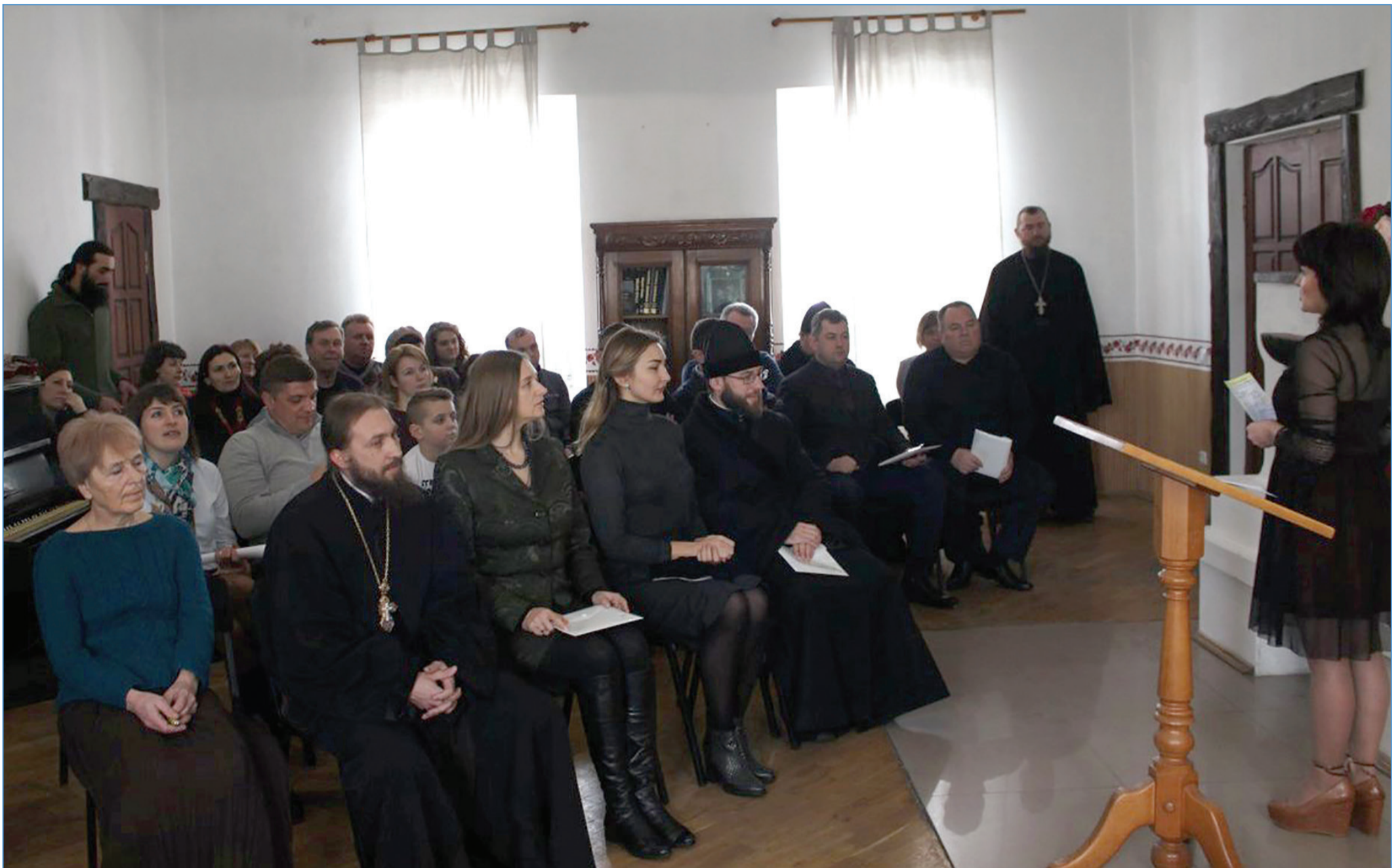
«Жидичинська лавра – забута історія» – представлення наукового проекту з такою назвою відбулося 17 лютого в чоловічому монастирі Святителя Миколая Чудотворця, що в с. Жидичин Ківерецького деканату. Докладніше про подію – на с. 4