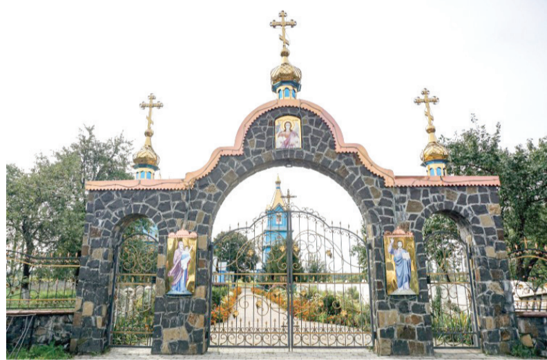
Церква в с. Липно

Цікавлюся у священика, чи не має наміру передати ці на правду раритети у Ківерцівський чи обласний краєзнавчий музей?