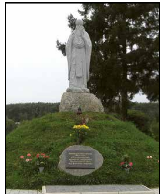
Пам'ятник Макарію (Токаревському) встановлено в Овручі, освячено 2008 року