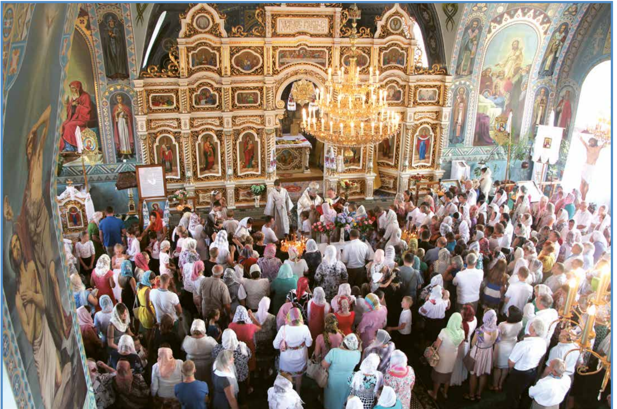
У Ківерцях відзначили подвійний ювілей собору Покрови Пресвятої Богородиці. Докладніше про подію – на с. 5