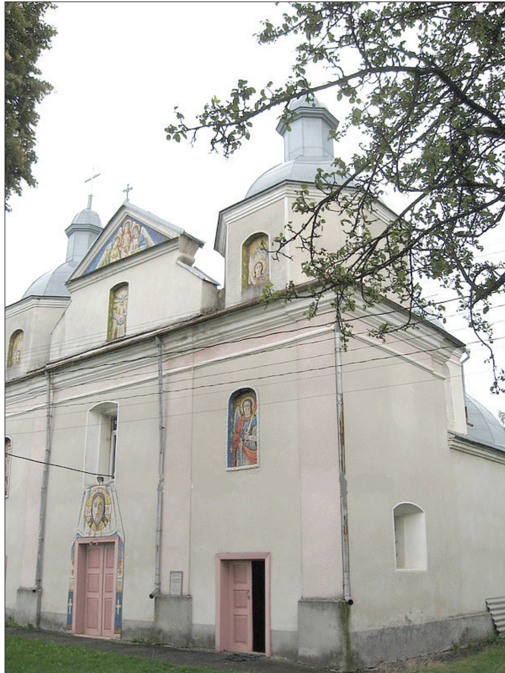
Свято-Михайлівський храм у с. Білосток

Звідси логічно випливає думка, що, ймовірно, чи не головну роль у виїзді сюди Іова (Кондзелевича) відіграли його релігійні погляди, оскільки Львівська єпископія на чолі з Йосифом (Шумлянським) схилилась до унії. А Іов