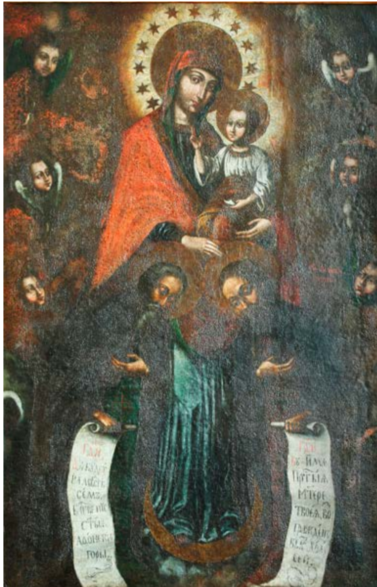
Хоругва «Богородиця з Антонієм і Феодосієм Печерськими / Всі святі» Початок XVIII ст. Полотно, левкас, олія. Походить зі Свято-Михайлівської церкви с. Великий Окорськ Локачинського району. Зберігається у Музеї волинської ікони

У 2017-му виповнюється 350 років від дня народження цього видатного українського іконописця та релігійно-громадського діяча.