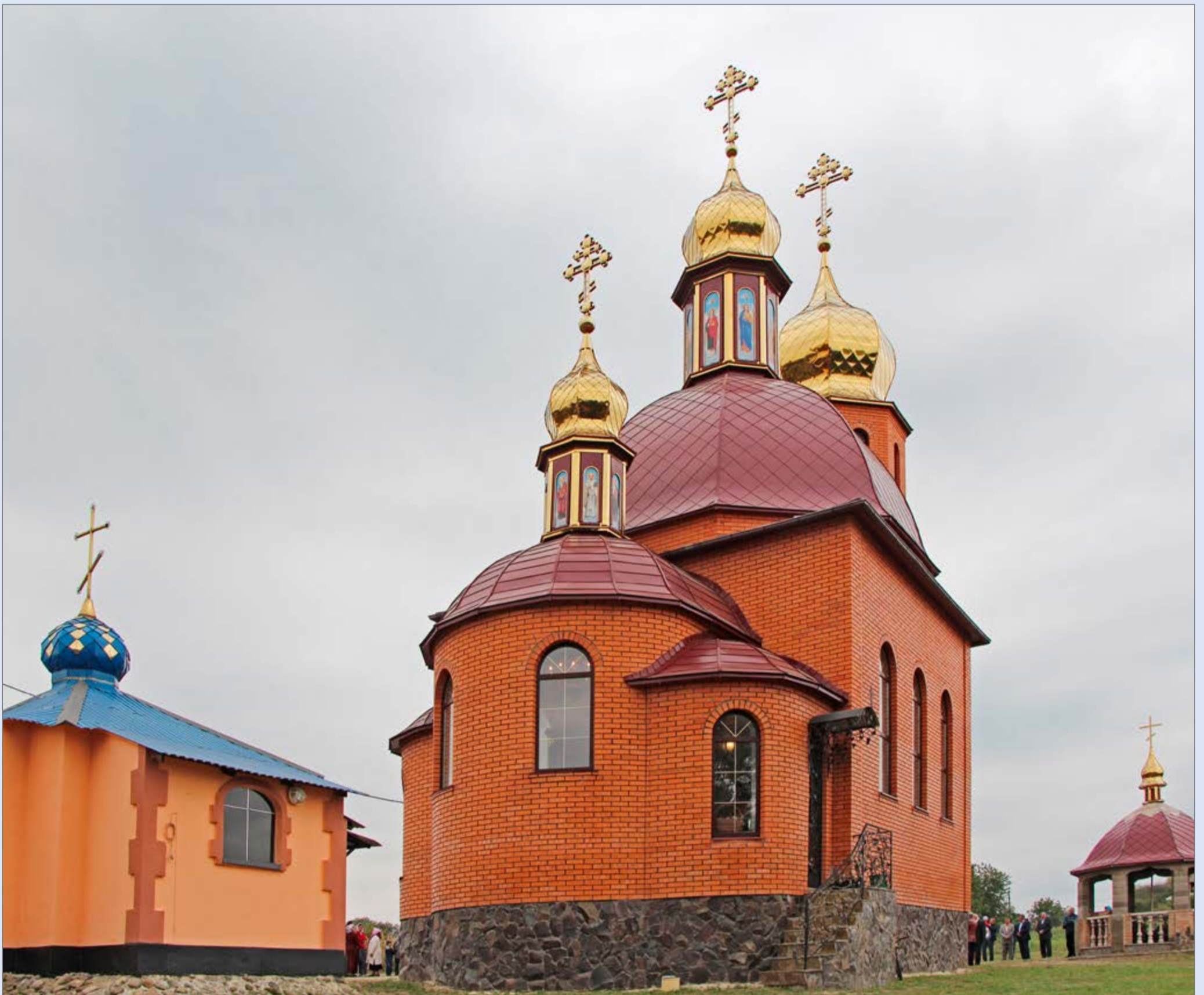
Новий храм Первоверховних апостолів Петра і Павла у с. Волиця Іваничівського деканату, який 18 вересня освятив митрополит Луцький і Волинський Михаїл. Більше про цю подію – на с. 5.