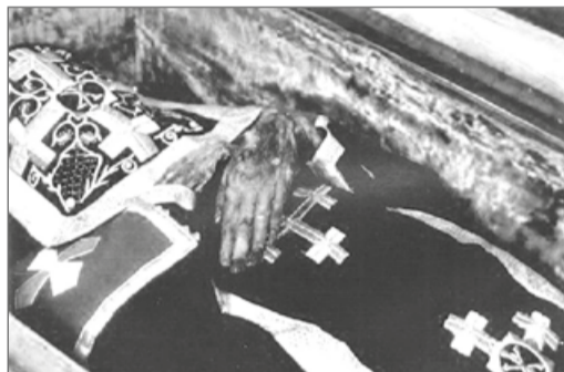
Мощі преподобного Руфа у Дальніх печерах