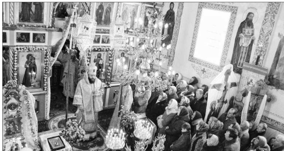
На празнику в Колоні