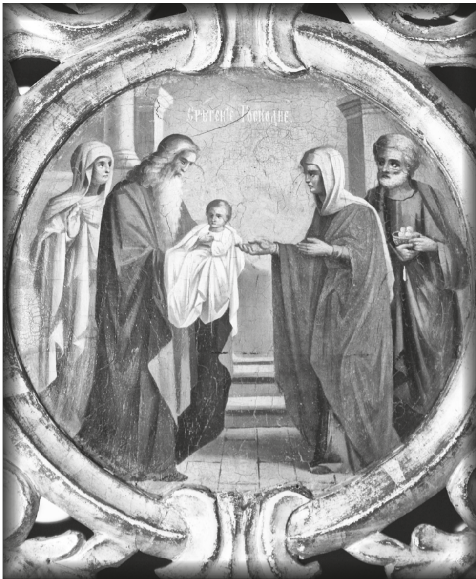
Образ «Стрітєння Господнє». Кін. XVIII – поч. XIX ст. Походить із храму Мучеників благовірних князів Бориса і Гліба с. Романів Луцького районного деканату. Матеріали й техніка: дерево (липа), левкас (грунт із крейди і клею), олія, різьблення, золочення. Зберігається у Музеї волинської ікони.

Стрітєння Господнє – одне з дванадцяти найбільших свят Православної Церкви. Воно було встановлено як урочисте нагадування про принесення до храму Пресвятою Богородицею Ісуса Христа на 40-й день після народження. Слово «стрітєння» означає «зустріч». Це зустріч Дитя Христа з праведником Симеоном, це і символічна зустріч Нового і Старого Заповітів. У цей день у церквах традиційно освячують і запалюють свічки як нагадування про слова Симеона Богоприїмця: «...світло на просвітлення язичників...».