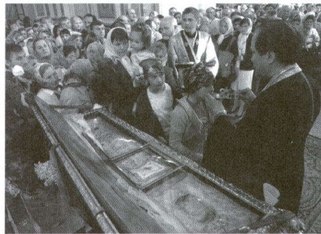
До мощей великомучениці Варвари. Луцьк, 20 травня 2006 року.

Святотатство – тяжкий гріх. Але підняття тіл мучеників не для зневаги і наруги, а для їх розділення і поширення серед