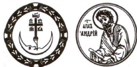
Братство Луцьке Крестъ Хрестовъ за геръхъ маєть

Непоодинокими були й силові методи вирішення суперечок. Зафіксовано крива-