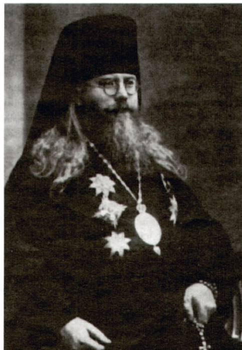
Архієпископ Олексій (Громадський)

Тому церковно-громадський провід на підставі ухвал церковних рад на Волині, зв'язуючись у грудні 1941 року з митрополитом Діонісієм, якому Волинь каноні-