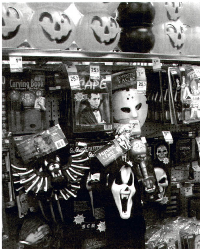
Західні крамниці до хелловіну готові

Германські племена англійці й сакси завоювали більшість кельтських земель, усі прийняли Християнство, зникли друїди. Але, як і в нас на Русі-Україні, пережитків язичництва залишилося доволі, серед них і свято на честь бога смерті. Щоб викоринити це зло, Церква в тих краях установила на цей день християнське торжество Всіх святих (у нас, у Східній Церкві, Всіх святих припадає на першу неділю після Трійці). Проте це не мало достатнього успіху: марновірні люди, під'юджені бісами, знущалися з християнського празника, переслідували тих справжніх християн, які не брали участі