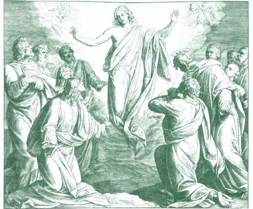
Гравюра на дереві Юліуса Шнорр фон Карольсфельда «Вознесіння»

Свято Господнього Вознесіння завжди припадає у четвер на сороковий день після Христового Воскресіння. Святитель Йоан Золотоустий у проповіді на Вознесіння каже: «Сьогодні людський рід досконало примирений з Богом. Зникла давня боротьба й ворожнеча. Ми, що були недостойні жити на