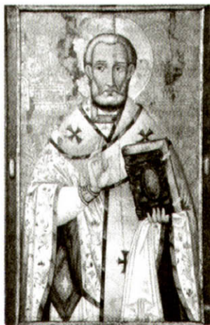
Образ святило Миколая Чудотворця зі збірки Музею волинської ікони

Пам'ятник святило – це місце, де проводять Богослужіння усі релігійні конфесії,