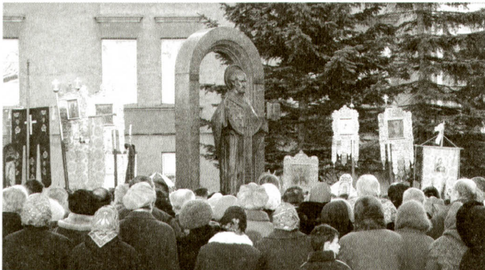
Лучани моляться до святителя Миколая Чудотворця перед його пам'ятником, що біля міської ради.

омофорі, з посохом і книгою), що підтверджується зафіксованими сфрагістичними даними луцьких міських печаток XVI–XVII ст., колекцією ікон у Волинському краєзнавчому музеї (80 % саме такої іконографії святого), а також має аналоги в українській книжковій графіці XVII ст. Зображається він з відкритою чи закритою книгою в одній руці, тримаючи при цьому пастораль (посох) в другій, або з благословляючим жестом. Поширене зображення св. Миколая пояснює, рідше – у повний зріст.