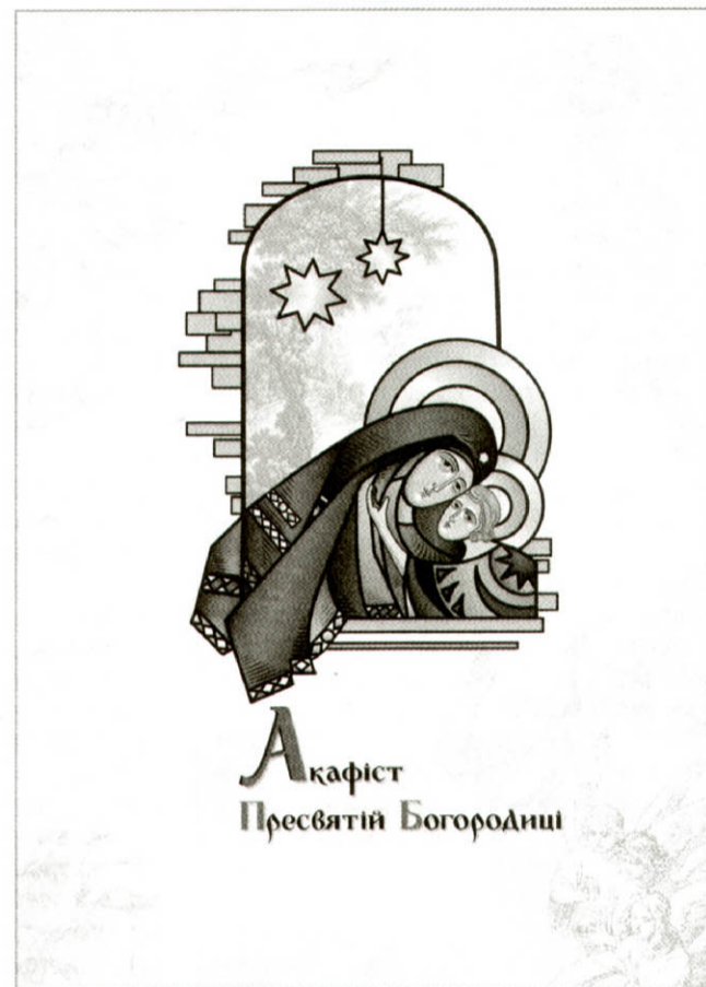
Акафіст Пресвятой Богородиці

Прикметою акафістів є й так звані херетизми: словом «радуйся» (гр. хере) починається велика кількість рядків. Але треба мати на увазі, що насправді це не дієслово, а вигук: по-грецьки ним вітаються при зустрічі (і прощаються), як українці вигуком «Доброго здоров'я!»