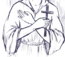
Мал. Ірини Дацюк

Сьогодні ми поведемо мову про деяких українських святих, котрі зараховані до лику Божих угодників іншими помісними Церквами. Адже Православ'я – єдине у вірі, а поділяється лише адміністративно.