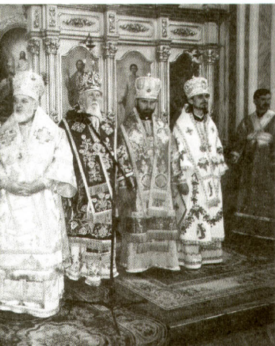
Михайла праворуч – архієпископ Тернопільський і Кременецький Іов, Сокальський Андрій, митрополит Рівненський і Острозький Євсей, і Кримський Климент, єпископ Тернопільський і Буцацький Нестор