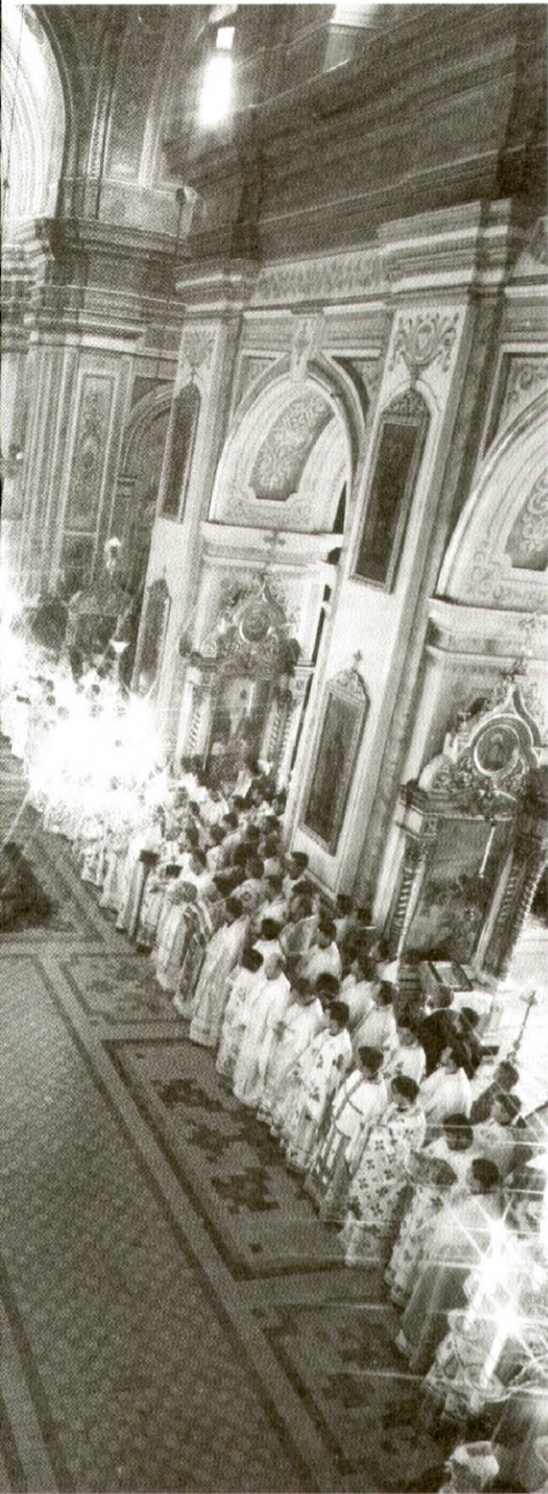
Літургія в кафедральному соборі з нагоди ювілею. 10 травня 2006 р.