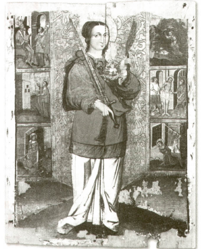
Ікона «Свята Варвара з житієм». Кінець XVII ст. З с. Колмів Горохівського р-ну. Зберігається в Музеї волинської ікони

Неспокійний період, який переживала Православна Церква на Волині в ті часи, відобразився і на подальшій долі частки мощей святої великомучениці. Єпископ Гедеон відчував сильний тиск з боку королівської влади Речі Посполитої, яка намагалася схилити його до прийняття унії. Побуюючи за своє життя, архієрей виїхав на Лівобережну Україну і вивіз туди ковчег із рукою святої Варвари. Ставши митрополитом, Гедеон помістив його у вівтарі Софійського собору. Після 1824 року його поклали до іншого ковчежця, який стояв за лівим криласом митрополичого храму. На початку 30-х років минулого століття ковчежець вивіз до Канади один із єпископів-емігрантів УАПЦ, яку тоді очолював митрополит Василь Липківський. Нині вона перебуває в кафедральному соборі Едмонтоні.