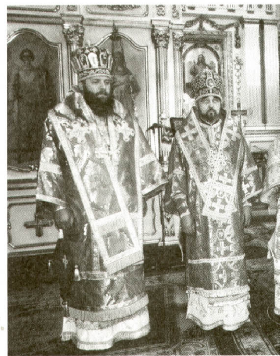
Вітання ієрархів. Від владика Митрополит Львівський і єпископ Сімферопольський