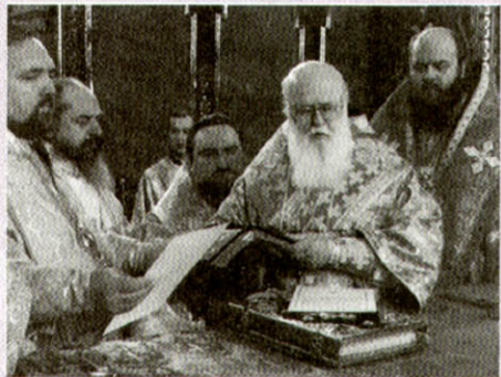
Єпископську висвяту звершують Патріарх Філарет, єпископ Михаїл та інші ієрархи

2 березня з нагоди 60-річчя митрополита Львівського і Сокальського Андрія владика разом із архієреями та духовенством Львівської єпархії відправив Божественну Літургію в кафедральному соборі Покрови Пресвятої Богородиці, що у Львові, та побував на урочистій академії у Львівському національному академічному театрі опери та балету імені Соломії Крушельницької.