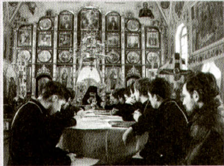
Збори Ковельського районного деканату

семинарію, принципи представлення священнослужителів до нагород, порядок передачі реліквій музеям та відродження українських церковних традицій щодо назв храмів, вшанування волинських ікон, вжитку Богослужбових риз тощо.