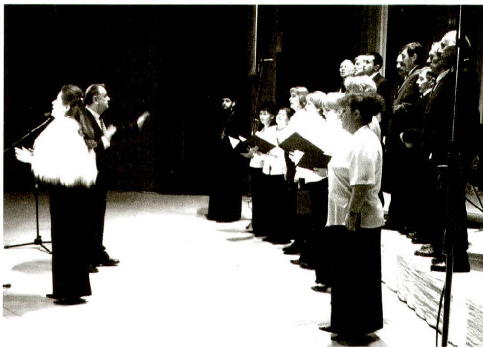
На сцені обласного муздрамтеатру – учасник Різвяного телерадіомарафону – хор Луцької Свято-Юр'ївської церкви

Марафон відкрили хори Київського Патріархату. Їх представив владика Михаїл, який і розпочав колядувати зі священнослужителями кафедрального собору Святої Трійці. Після них різдвяні піснеспіви виконали хори Центру християнського виховання дітей і молоді та Свято-Юр'ївської церкви, що в Луцьку. Пізніше виступали колективи Православної Церкви Московського Патріархату, Греко-Католицької та Римо-Католицької Церков, а також Церков християн евангелістів-п'ятдесятників, євангельських християн-баптистів та адвентистів сьомого дня.