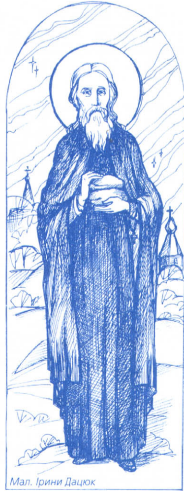
Мал. Ірини Дацюк

І коли трапилося отаке дивовижне чудо, вжахнувся той, хто насилля вчинив: не міг утаїти отих речей, які відбулися на очах у всього міста, й почав усвідомлювати, що то за справа. Тоді-то розповіли князеві й про інше, що сотворив Блаженний. Коли лободою годував багато людей, у їхніх устах був той хліб солодким, а для тих, хто брав хлібину без його благословення, виявлялася вона (темною), наче земля, й гіркою, наче полин, на устах їхніх. Почув це князь, і охопив його сором за скоєне, і пішов він у монастир до ігумена Йона, і покався перед ним.