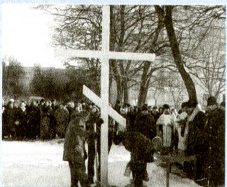
Освячення хреста на місці будівництва Свято-Благовіщенського храму в Луцьку

22 січня владика очолив Божественну Літургію в Луцькому Хрестовоздвиженському храмі з нагоди освячення оновленої вівтарної частини. А пізніше, того ж дня, преосвященний освятив хрест на місці спорудження майбутнього храму Благовіщення Пресвятої Богородиці в Луцьку. Землю під будівництво церкви нещодавно виділила новоствореній громаді Луцька міська рада.