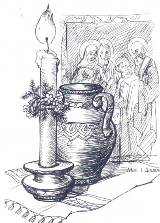
Мал. І. Дацюк

Окрім урочистої Служби Божої, на честь Стрітення у церквах святять воду і свічки-громниці. Здавна їх вважали помічними від грому. Крім того, ці свічки колись давали у руки померлим, коли читали відхідну. Свічка символізує нерозривність земного світу й небесного.