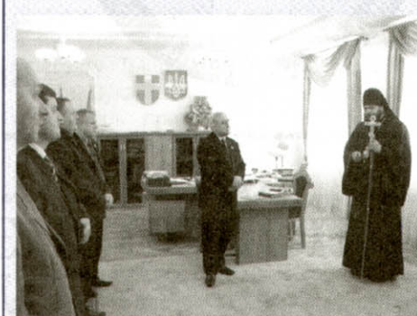
Преосвященний вітає голову облради та депутатів