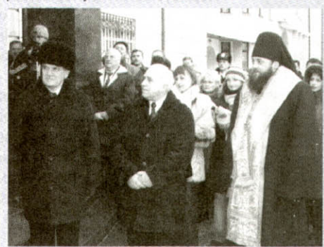
Голова Верховного Суду Василь Маляренко, голова облради Василь Дмитрук і єпископ Михайл перед приміщенням апеляційного суду

На урочистостях, у яких також брали участь голова Волинської обласної ради Василь Дмитрук, голова Верховного Суду України Василь Маляренко, народні депутати та багато інших високо-