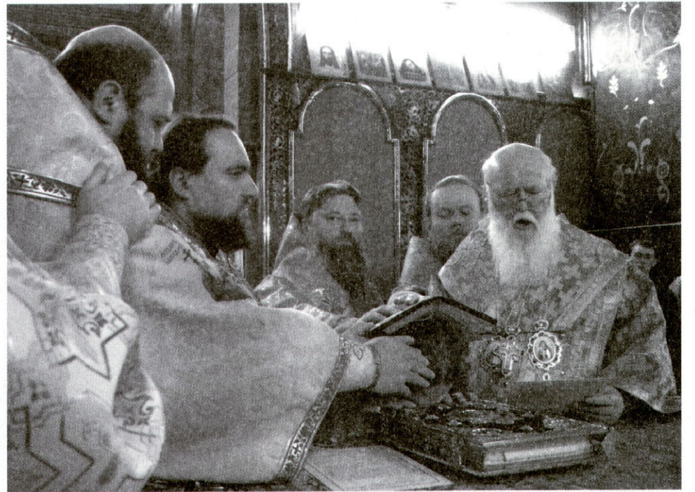
Патріарх Філарет, архієпископ Михаїл та інші архієреї висвячують архімандрита Марка (Левківа) на єпископа.

Монах – означає «один». Один-на-один із руїною, де між шибками шугає вітер, дощ і сніг не дають просохнути стінам, відривається цегла. Такий спадок радянського