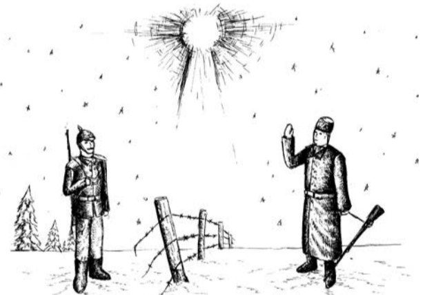
Ілюстрація Арсена ГРЕБЕНЮКА

Доспівав – і вже аж тоді осунувся на руки побратимові й той, підтримавши, поклав його собі на коліна.