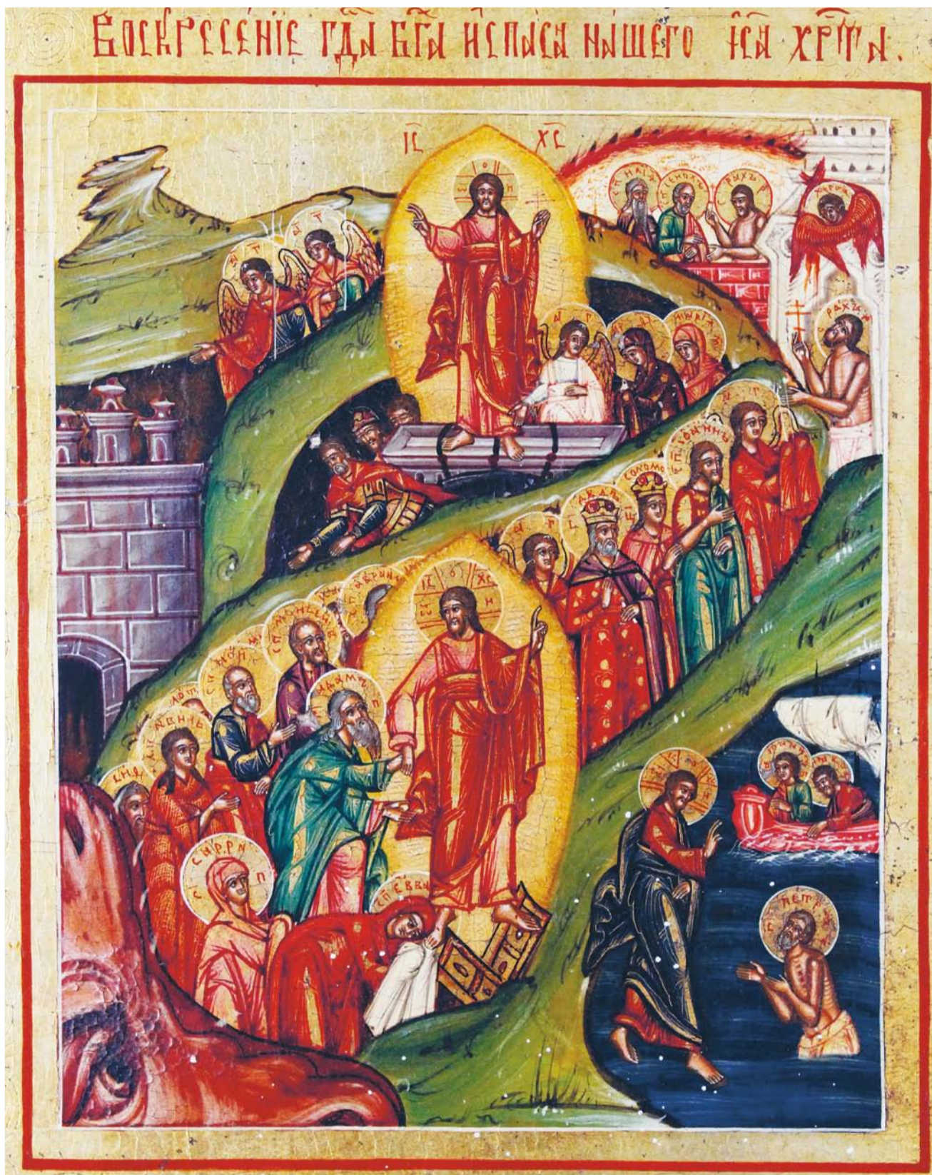
«Воскресіння Господа Бога і Спаса нашого Ісуса Христа». Центральна частина образу дванадцятих свят. Кін. XIX ст. Україна. Зберігається у Музеї волинської ікони

+ Михайло митрополит Луцький і Волинський