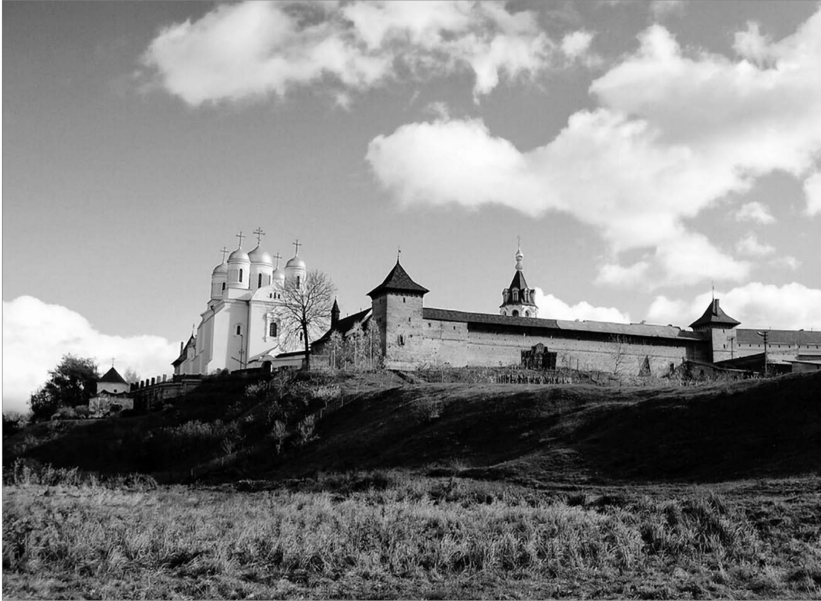
Радянська влада певний час «терпіла» Зимнівський монастир. Але 17 березня 1949 р. закрила і його.

Заходи зі скорочення чисельності духовенства поступово давали результати. Протягом IV кварталу 1948 р. з Волинської області вибуло 11 священнослужителів. М. Діденко писав: зменшення служителів культу буде тривати у зв'язку з тим, що окремі церкви приписуються до інших, а деякі храми і релігійні громади будуть зняті з реєстрації через смерть священників.