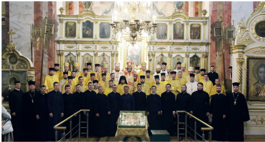
і Волинським Михаїлом, зокрема, правили архієпископ Володимирський і Нововолинський Матфей, єпископ Запорізький і Мелітопольський Фотій, єпископ Херсонський і

З нагоди випуску цього дня відслужили Божественну літургію в кафедральному соборі Святої Трійці. Із митрополитом Луцьким