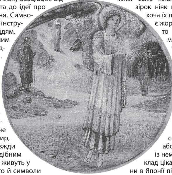
«Вишневська зірка». Картина Едварда Берна-Джонса, між 1882 та 1898 роками

носіям певної культури. Так, хрест сам по собі є лишень геометричною фігурою; але розміщений на бані церкви, стає символом християнства та отримує низку асоціацій: від постаті Ісуса Христа до ідеї про обіцяне воскресіння. Символи є своєрідними інструментами, знаряддям, лише призначеним для роботи в середовищі культури. Можна провести паралель: сокира завжди має лезо й держак, незалежно від того, де й коли її створено, бо її будова зумовлена її призначенням. Де б і коли не жили творці сокир, їхні знаряддя завжди будуть схожі. Подібним чином, якщо люди живуть у подібних умовах, то й символи вони створюють подібні. Християнство не володіє виключним правом на зображення хреста, багатокутну зірку чи, скажімо, розписані яйця. Так само, як не володіє ними будь-хто іще.