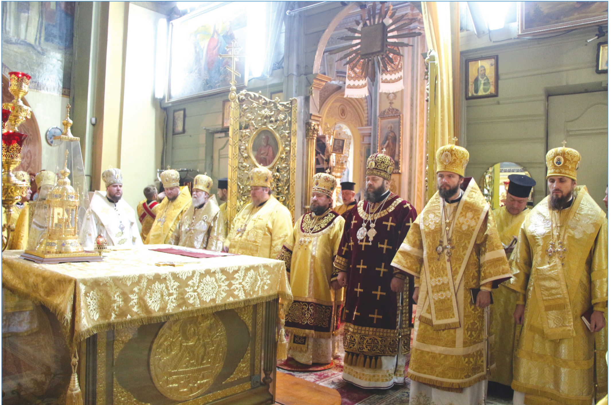
У Луцьку відзначили Собор волинських святих та 25-ліття відродження Волинської православної богословської академії. Про подію читайте на с. 5