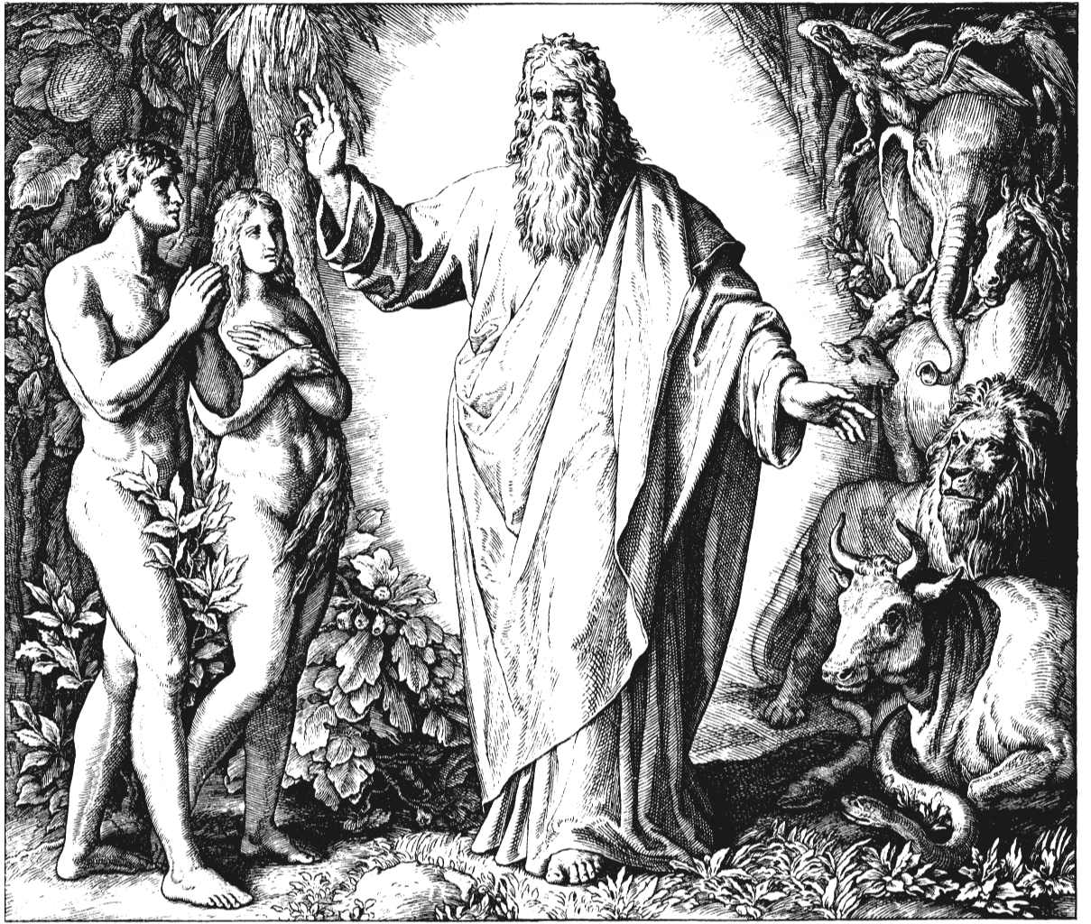
Гравюра Ю. Ш. Карольсфельда

За словами Йоана Золотоустого, спочатку всі творіння були підвладні людині. Звірі тремтіли і боялися свого владика. Коли ж людина через непослух втратила відвагу, тоді й влада її змінилася.