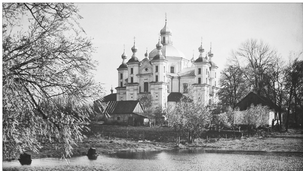
Храм Покрови Пресвятої Богородиці в с. Піддубці Луцького районного деканату. Початок 1950-х років

й англійською мовами. Видання має тверду палітурку, суперобкладинку і є чудовим подарунком. Його можна придбати за 200 гривень, відвідавши Музей волинської ікони.