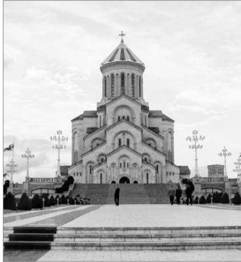
Патріарший собор Святої Трійці у Тбілісі

Тут народ завжди живив вірою, а Церква – невід'ємна частина життя грузинів. На цьому наголосив на початку зустрічі з нами