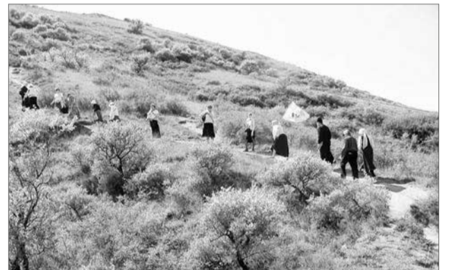
Підняття до місця страти 6000 мучеників грузинських біля монастирського комплексу Удабно

– Церква для Грузії – все. Це не тільки спосіб виживання. Хоча Грузія виживала своєю вірою. Ви вже знаєте історію про сто тисяч мучеників. Коли мусульмани завоювали Тбілісі, їхній правитель сів на зруйновано-