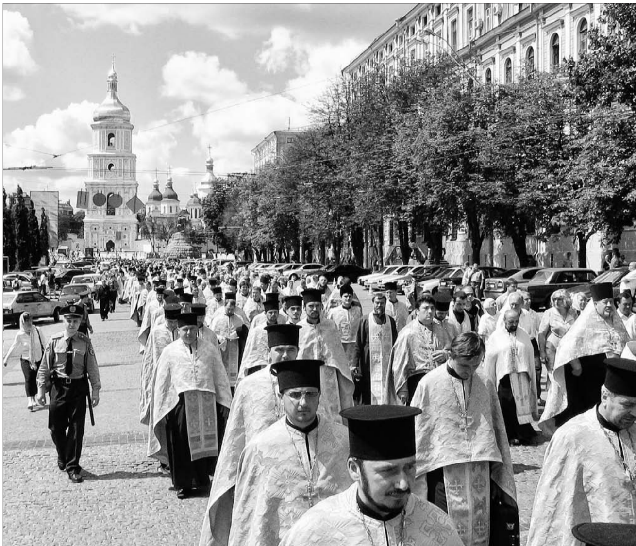
28 липня 2009 р., Київ. Хресний хід нашого Патріархату

Приїзд Московського Патріарха Кирила в Україну, як і прогнозували, став візитом розчарування. Але в результаті – Київський Патріархат став лише міцнішим